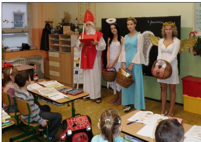
Mikulášskou nadílku výborně připravili žáci 9.B.